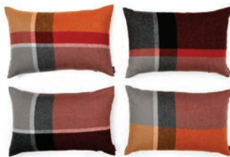
9065 TERRACOTTA / RED MAGMA