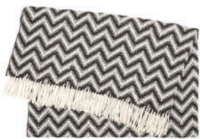
6090 BLACK / WHITE

Zigzag Decken Kollektionen. Ein Zusammentreffen schöner markanter Linien und natürlich weicher Geschmeidigkeit in 100% Baby Alpaka-Wolle. Das Design zeigt sich im zweifarbigen Strick-Look. Klare geometrischen Zick-Zack-Linien bewegen sich quer zueinander und bilden ein attraktives Farbspiel in den Kombinationen.