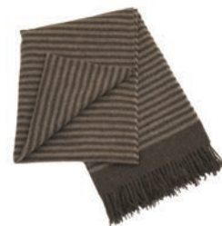
7202 COFFEE / BEIGE