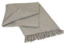
6005 LIGHT GREY