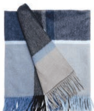
7068 STEEL BLUE / DUSTY OCEAN