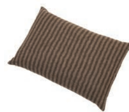
9202 COFFEE / BEIGE