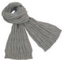
4302 LIGHT GREY

Die gestrickten Schals haben eine wunderbare Struktur wie ein gedrehtes Seil. Sie sind als Schlauch-Modell oder in klassisch offen gestrickter Variante erhältlich. Das Zopfmuster ist sportlich dekorativ. Sie werden in 100% Baby Alpaka-Wolle gestrickt und fühlen sich wunderbar weich an.