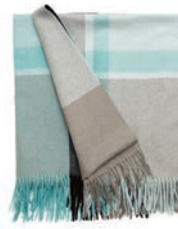
7069 JADE GREEN / DUSTY GREEN