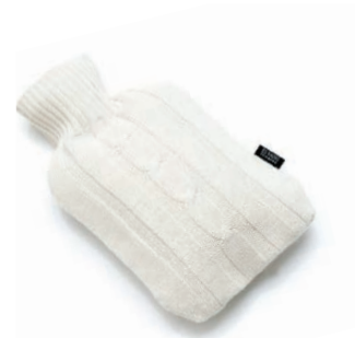
3050 OFF WHITE