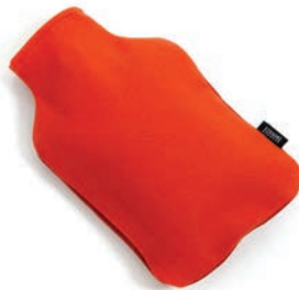
3001 DANCING FLAME / RED