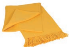
6009 BRIGHT SUNSHINE