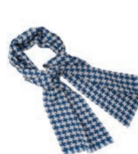
4163 LIGHT GREY / PETROL