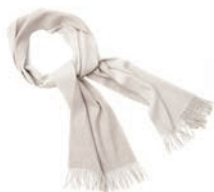
4109 BEIGE / OFF WHITE

Die Unisex Schals werden von Männern wie auch von Frauen gerne getragen. Die Schals werden doppelseitig in Doubleface-Webtechnik in unterschiedlichen Farben gewebt. Sie sind aus 100% Baby Alpaka-Wolle und fühlen sich auf der Haut wunderbar weich an.