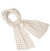
4160 BEIGE / OFF WHITE

Schicke, symmetrische PEPITA-Schals mit klassischem, zweifarbigem Hahnentritt-Muster. Dünn gewebt aus luxuriöser Alpakawolle und einfach wunderschön in 100% Baby Alpaka-Wolle.