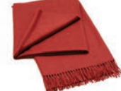
7023 RED MAGMA