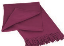
6015 VIOLET RED