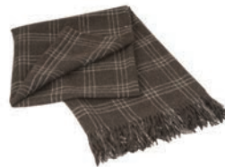
6082 CHOCOLATE / WHITE