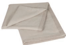
6055 WHITE / BEIGE

CHOICE Decken Kollektion ist eine elegante Decke in Doubleface-Webtechnik in 100% Baby Alpaka-Wolle. Die spezielle Art des Webens verleiht der Decke zwei unterschiedlich farbige Seiten. Wunderschön verarbeitet mit einer Webumrandung, warm und ausdrucksvoll.