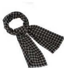
4161 BLACK / GREY