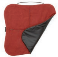
3123 RED MAGMA