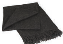
6007 DARK GREY