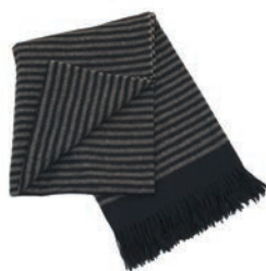
7201 BLACK / BEIGE