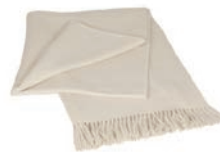
6004 OFF WHITE