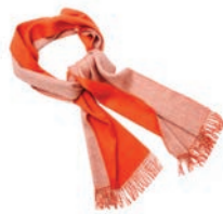
4112 BEIGE / WATERMELON