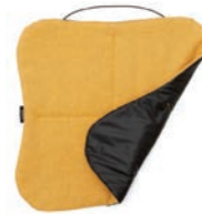
3120 YELLOW OCHER