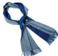
4113 LIGHT GREY / PETROL