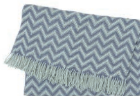
6092 JADE GREEN / PETROL