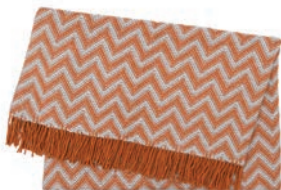
6091 COPPER / STEEL