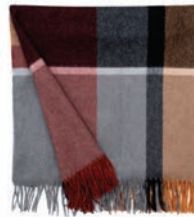
7065 TERRACOTTA / RED MAGMA