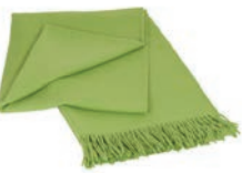
6024 SPRING GREEN