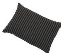
9201 BLACK / BEIGE