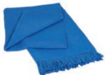
6019 OCEAN BLUE