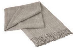
6081 LIGHT GREY / WHITE