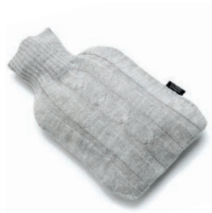
3051 LIGHT GREY