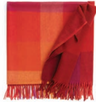
7102 FLAME RED