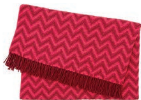
6094 PINK / BORDEAUX