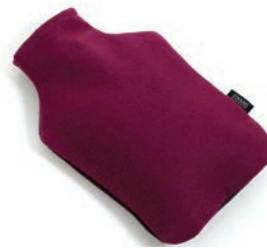
3002 VIOLET RED / PLUM