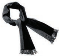
4108 BLACK / GREY