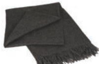
7006 DARK GREY