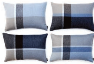
9068 STEEL BLUE / DUSTY OCEAN