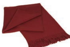
6012 DARK RED