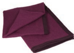
6060 PLUM / VIOLET RED