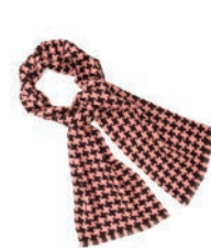
4165 POWDER / AUBERGINE