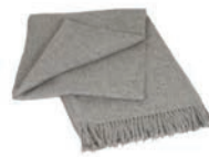
7004 LIGHT GREY