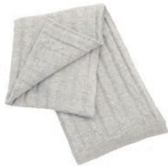
5101 LIGHT GREY