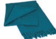
7018 PETROL BLUE