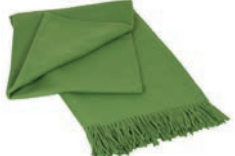
6025 GRASS GREEN