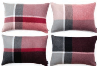
9067 ROSA / BOUDEAUX