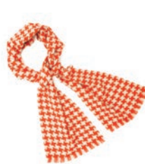
4162 BEIGE / WATER MELON