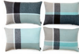
9069 JADE GREEN / DUSTY GREEN