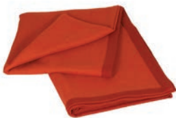
6054 RED / DANCING FLAME