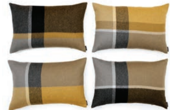
9066 YELLOW OCHER / SMOKED GLASS