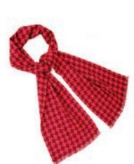
4166 PINK / BORDEAUX