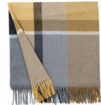
7066 YELLOW OCHER / SMOKED GLASS