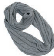
4402 LIGHT GREY