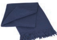
7011 DARK BLUE