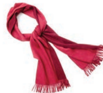
4116 PINK / BOUDEAUX