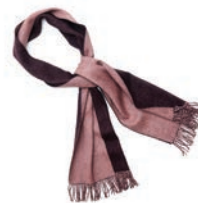
4115 POWDER / AUBERGINE