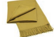
7021 SMOKED GLASS