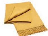
7020 YELLOW OCHER