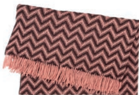
6093 POWDER / AUBERGINE