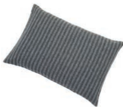
9200 DARK GREY / GREY