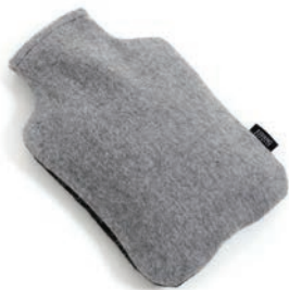
3000 LIGHT GREY / DARK GREY

Wärmflaschen aus weicher Baby Alpaka-Wolle. Diese schönen Bezüge für den alten, beliebten Klassiker werden in zwei schönen Designs angeboten. Einfarbig gestrickt in vier Farben oder zweifarbig gewebt mit je einer Farbe auf jeder Seite. Die Bezüge werden mit einer 2-Liter Wasserflasche geliefert die phthalatfrei ist und keine hormonstörenden Stoffe aufweist. Sie werden in 100% Baby Alpaka-Wolle gestrickt und fühlen sich wunderbar weich an.