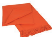
6011 DANCING FLAME