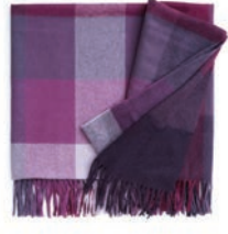
7104 ORCHID LILAC