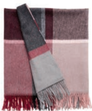
7067 ROSA / BOUDEAUX

MANHATTAN Decken und Kissen Kollektion. Eine Spiegelung der schnurgeraden Straßen von New York's Stadtteil Manhattan. Inspiriert durch die quadratischen Blöcke entstanden horizontale und vertikale Linien die Kontrast und Lebendigkeit erzeugen. Es ist ein junges Design, das sich dennoch klassisch präsentiert.