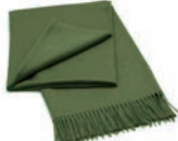
7017 FOREST GREEN