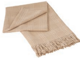
6080 BEIGE / WHITE

SUPERIOR Deckenkollektion gefertigt aus 100% feinsten Baby Alpaka-Wolle. Hier verschmelzen Natürlichkeit, Weichheit und Design zu einer anspruchsvollen Decke. Die Weichheit ist außergewöhnlich, weil die Fasern absolut naturbelassen sind und nur die feinsten Wollfasern ausgewählt werden.