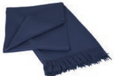
6017 DARK BLUE