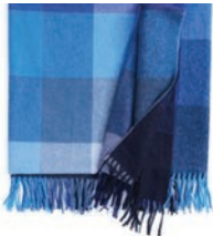
7103 TITICACA BLUE