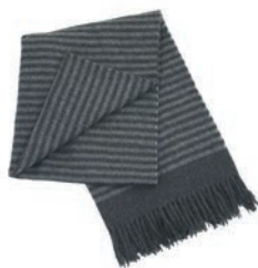
7200 DARK GREY / GREY