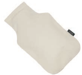
3003 OFF WHITE / BEIGE